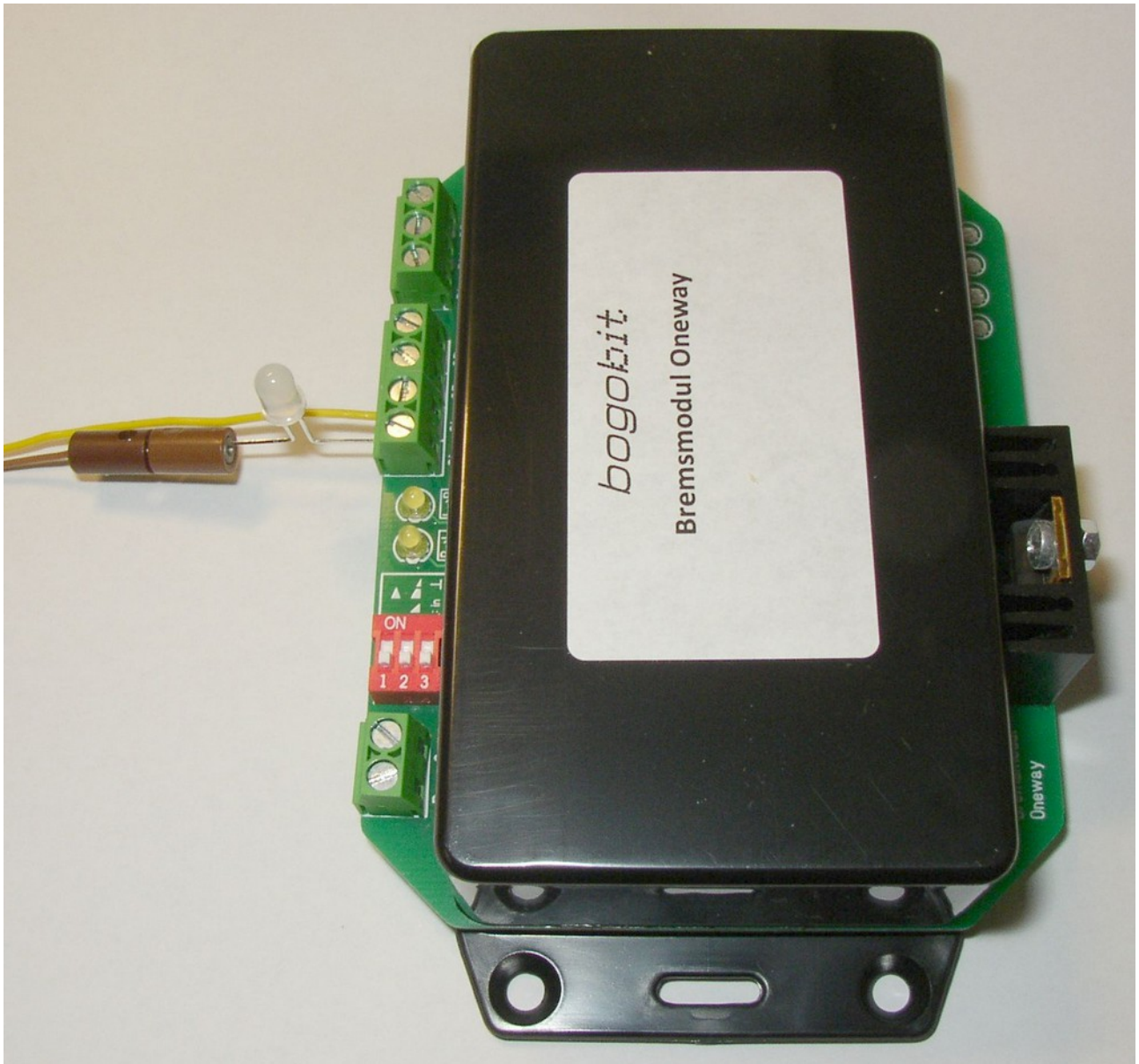
Abbildung 3: Anschlussbeispiel am Steuereingang SL des Bremsmoduls – Gesamtansicht